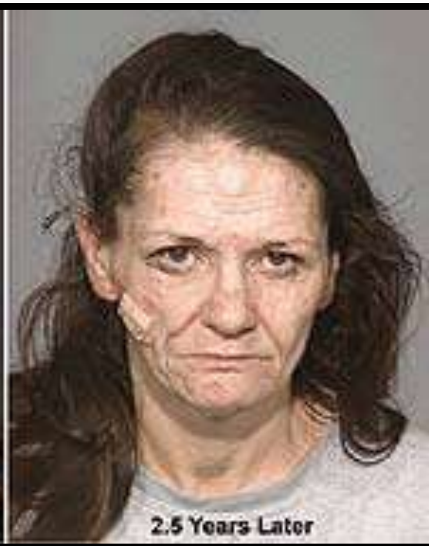
2.5 Years Later