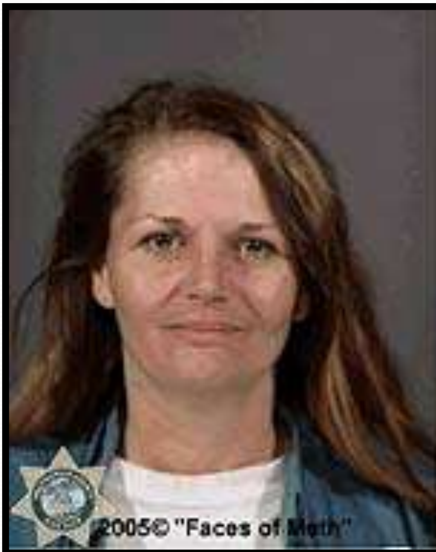
2005 © "Faces of Meth"