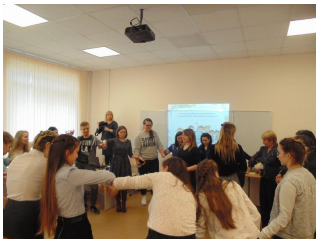
Игра на сплочение коллектива « Карандаши».