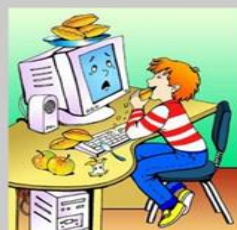
Не ешь за компьютером