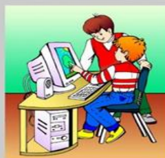
Не касайся монитора руками