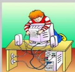
Не ремонтируй компьютер сам