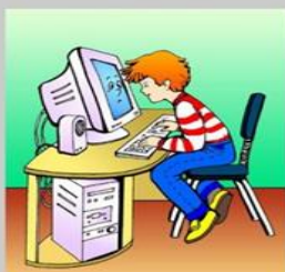
Не сиди близко к монитору